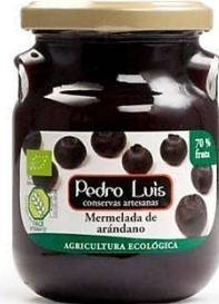
Mermelada de arándano Eco 22,77€ Frasco A-275 Neto: 300 g Capacidad: 275 ml