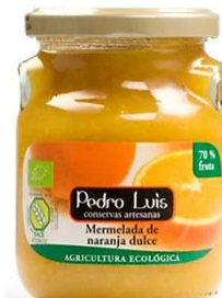
Mermelada de naranja dulce Eco 13,93€ Frasco A-275 Neto: 300 g Capacidad: 275 ml