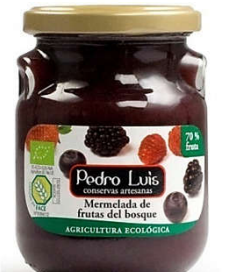
Mermelada de frutas del bosque Eco 41,05€ Frasco A-275 Neto: 300 g Capacidad: 275 ml