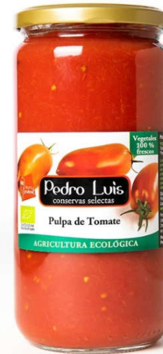
Pulpa de Tomate Eco

Frasco B-370 / V-720 Neto: 340 g/660 g Capacidad: 370/720 ml