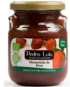
Mermelada de fresa Eco 13,93€ Frasco A-275 Neto: 300 g Capacidad: 275 ml