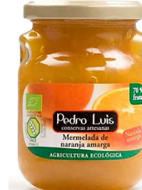
Mermelada de naranja amarga Eco 32,74€ Frasco A-275 Neto: 300 g Capacidad: 275 ml