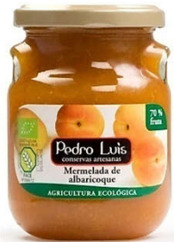
Mermelada de albaricoque Eco 13,93€ Frasco A-275 Neto: 300 g Capacidad: 275 ml