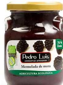
Mermelada de mora Eco 41,05€ Frasco A-275 Neto: 300 g Capacidad: 275 ml