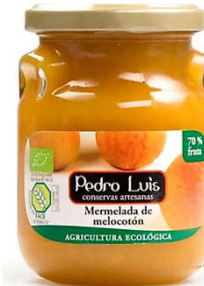
Mermelada de melocotón Eco 27,85€ Frasco A-275 Neto: 300 g Capacidad: 275 ml