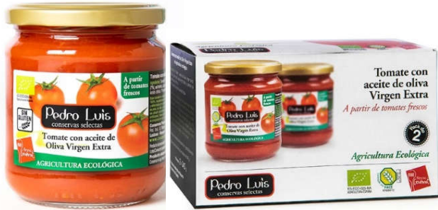
Tomate con aceite de oliva virgen extra

Frasco B-370 Neto: 340 g Capacidad: 370 ml