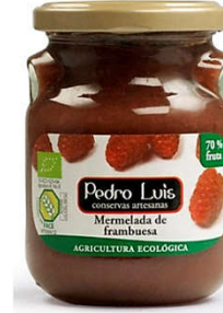
Mermelada de frambuesa Eco 41,05€ Frasco A-275 Neto: 300 g Capacidad: 275 ml