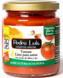
Tomate para untar

Frasco B-250 Neto: 235 g Capacidad: 250 ml