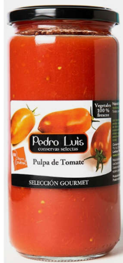
Pulpa de Tomate

Frasco V-720 Neto: 660 g Capacidad: 720 ml