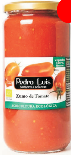
Zumo de Tomate Eco