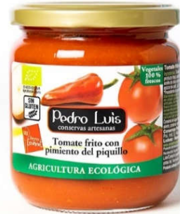
Tomate frito con piquillo

Frasco B-370 Neto: 340 g Capacidad: 370 ml