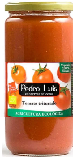
Tomate triturado Eco

Frasco B-370 / V-720 Neto: 340 g/660 g Capacidad: 370/720 ml