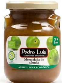
Mermelada de ciruela Eco 16,37€ Frasco A-275 Neto: 300 g Capacidad: 275 ml